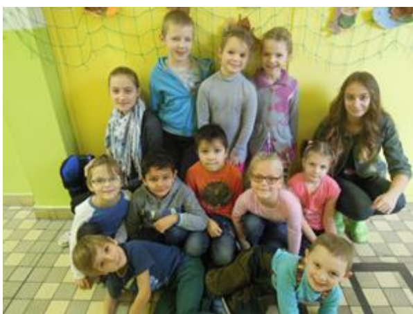
I. A a I. B s reportérkami