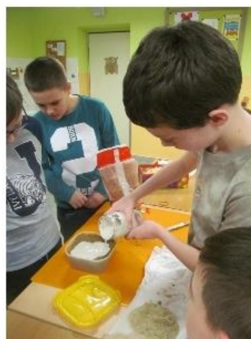
1. Otisk vlčí stopy 2. příprava sádry 3. odlévání stopy